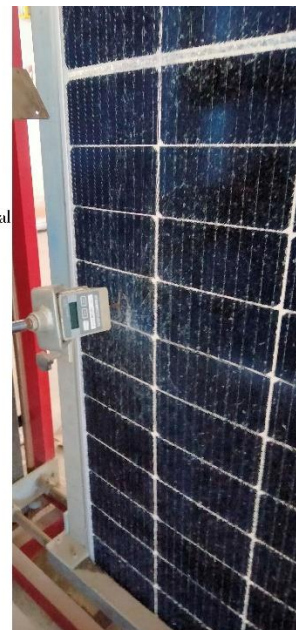
Estudio del comportamiento real de módulos aeroelásticos.

Grietas y fracturas del cristal protector ante deformaciones cíclicas